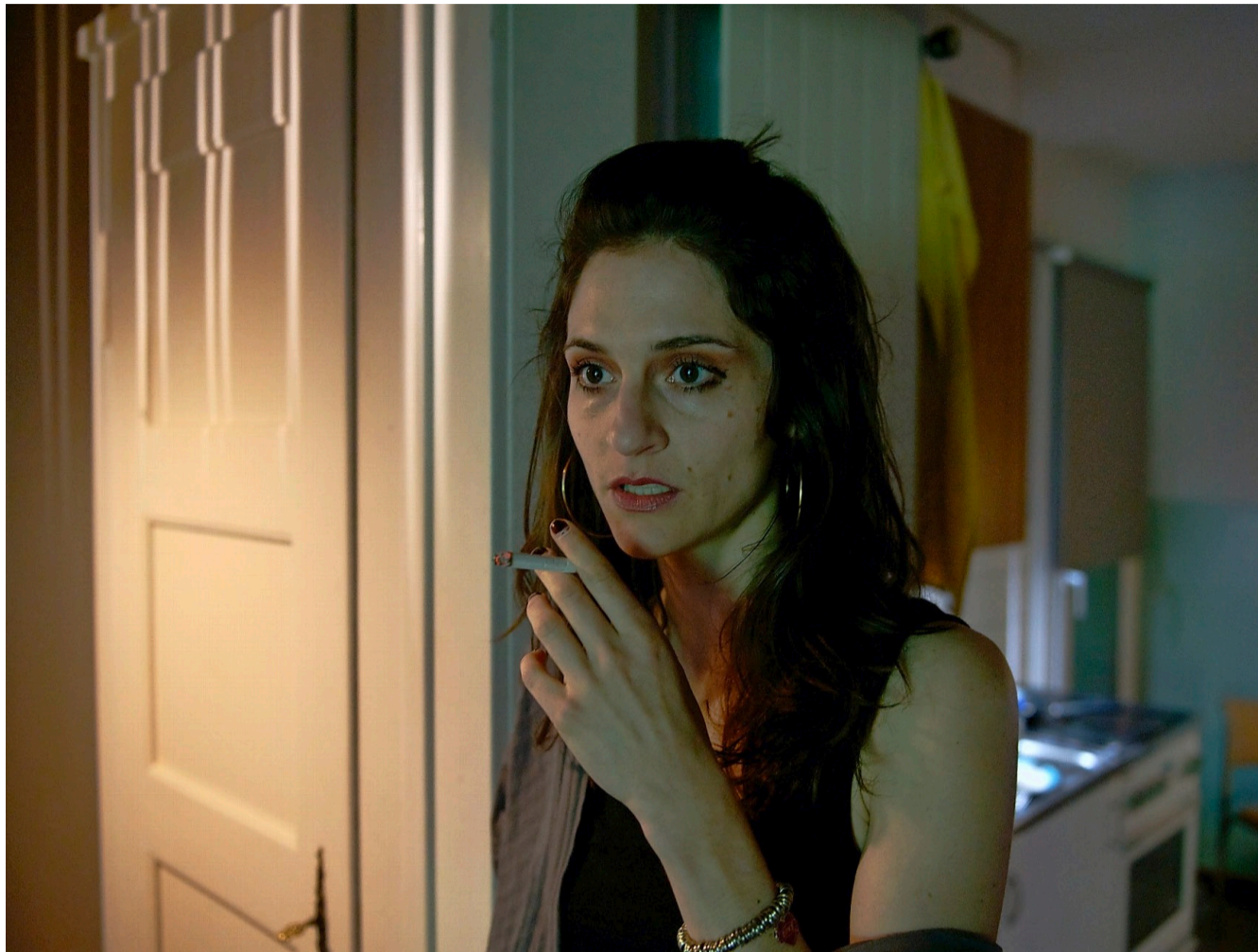
Die Antworten liegen in der Zweizimmerwohnung: Was treibt Julie zu Kettenrauchen und Schlaflosigkeit?

Das kritische Ausgehmagazin für Bern. Veranstaltungen von 24. bis 30. Januar 2013